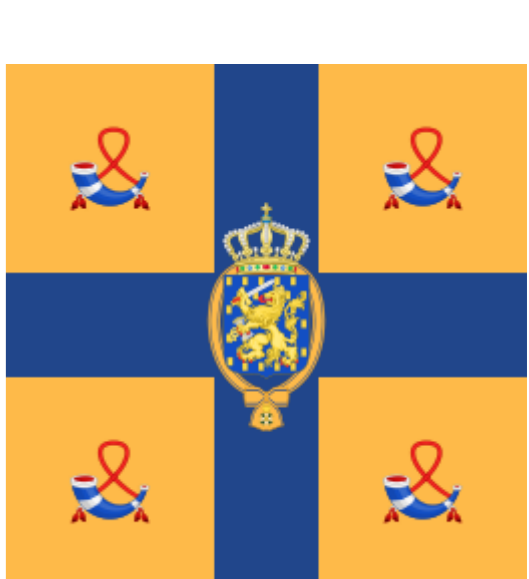
Vlag van de koning der Nederlanden