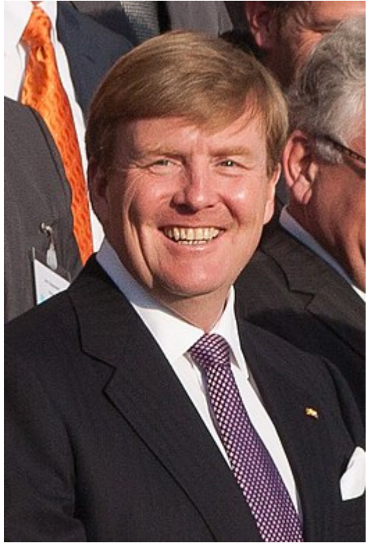
De huidige koning Willem-Alexander.

De tekst is beschikbaar onder de licentie Creative Commons Naamsvermelding/Gelijk delen, er kunnen aanvullende voorwaarden van toepassing zijn. Zie de gebruiksvoorwaarden voor meer informatie. Wikipedia® is een geregistreerd handelsmerk van de Wikimedia Foundation, Inc., een organisatie zonder winstoogmerk.